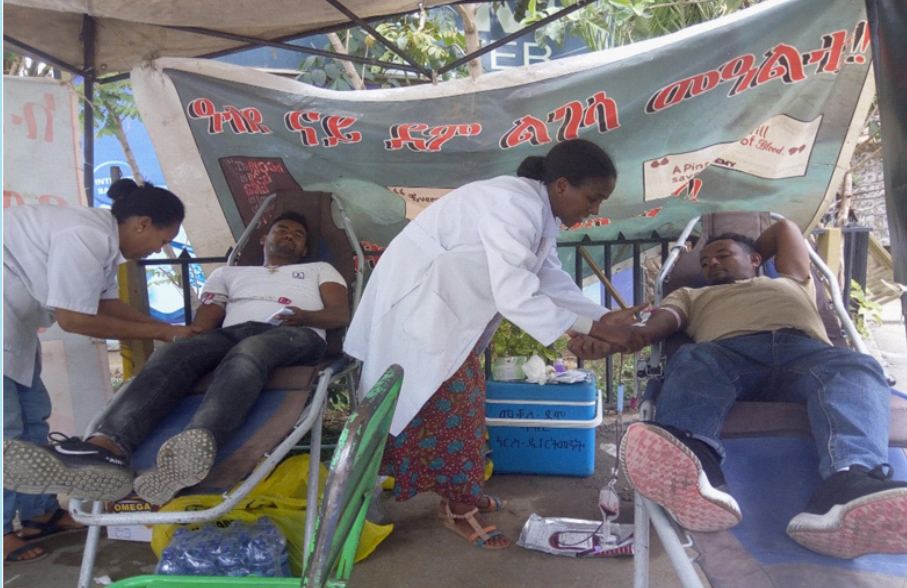
መናእሰይ ኣብ ምልጋስ ደምን ክረምታዊ ወፍርን

ረብሓ ኣገልግሎት ዓርሰ ተበግሶ ዓብዩን ሰፊሕን እዩ። ነዚ ዝተረዳኣ ሃገራት ህዝብን ኣብዚ ዘለዎ ግንዛብ ኣዕብዩ ክኸትት ንምግባር ብዙሕ ሰራሕንን ኣዘዩ ልዑል ጥቕሚ ዝረኽባሉ ኣለዎ። ንኣብነት ሃገረ ኣሜሪካ ብ2015 ኣቆፃፅራ ኣውሮፓ ብብእዎኑ ህዝብ ብምኽታት፣ ከባቢ 184 ቢልዮን ዶላር ዝግመት ወፃኢ ንሃገሮም ከድሕኑ ክኢሎም