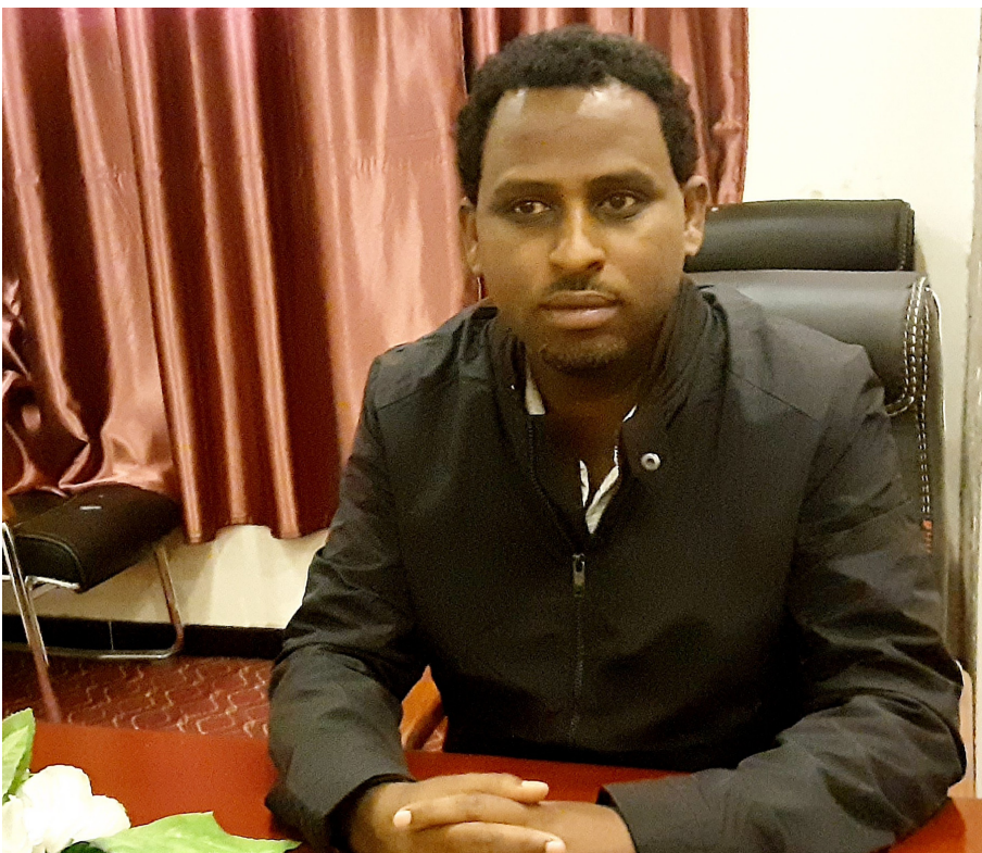
ኣቦ መንበርን መስራትን ማሕበር መስቀል ጮምዓ መቐለ ኣይተ ገ/ሀይወት ተ/ሃይማኖት

ከምኡውን ኣብቲ ከባቢ ዝተፈላለዩ ስራሕቲ ልምዳታት ይሰለጡ ኣለዉ። በቢ እዋኑ “ፕሮፖዛል” ብምቕራፅ ንሰብ ሃፍትን ትካላትን ብምሕታት እቶም ስራሕቲ ይሰለጡ እዮም። ብመሰረት ዚ ምስ