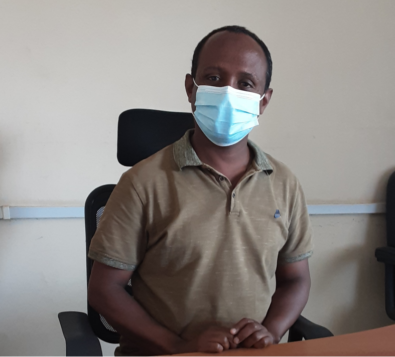
ኣብ ቢሮ ሓለዎ ጥዕና ክልል ትግራይ ከይዲ ስራሕ ምስጻም ጥዕናን ምክልኻል ሕማማትን መተሓባበሪ ኬዝ ቴም ስነ-መዳኒ ኣይተ መንግሥት ባህሪ ስላሴ

ካብዚ ብምብጋስ ቢሮ ሓለዎ ጥዕና ክልል ትግራይ ሕብረተሰብ ብሰንኪ ዘይምዕሩይ አመጋገብ ካብ ዝኸፍኦ ሕማማት ንምክልኻልን ንምቕናስን ግንዛብ ናይ ምፍጣር ስራሕቲ እናሰርሐ ፀኒሑ እዩ። ብመሰረት እዚ እውን ኣብ 2025 ዓ/ም ፈረንጂ “ውሕስት ስርዓት አመጋገብ ዝተረጋገፀላ፣ ጥዕና ዝሓለወ፣ ዝተማልኦ