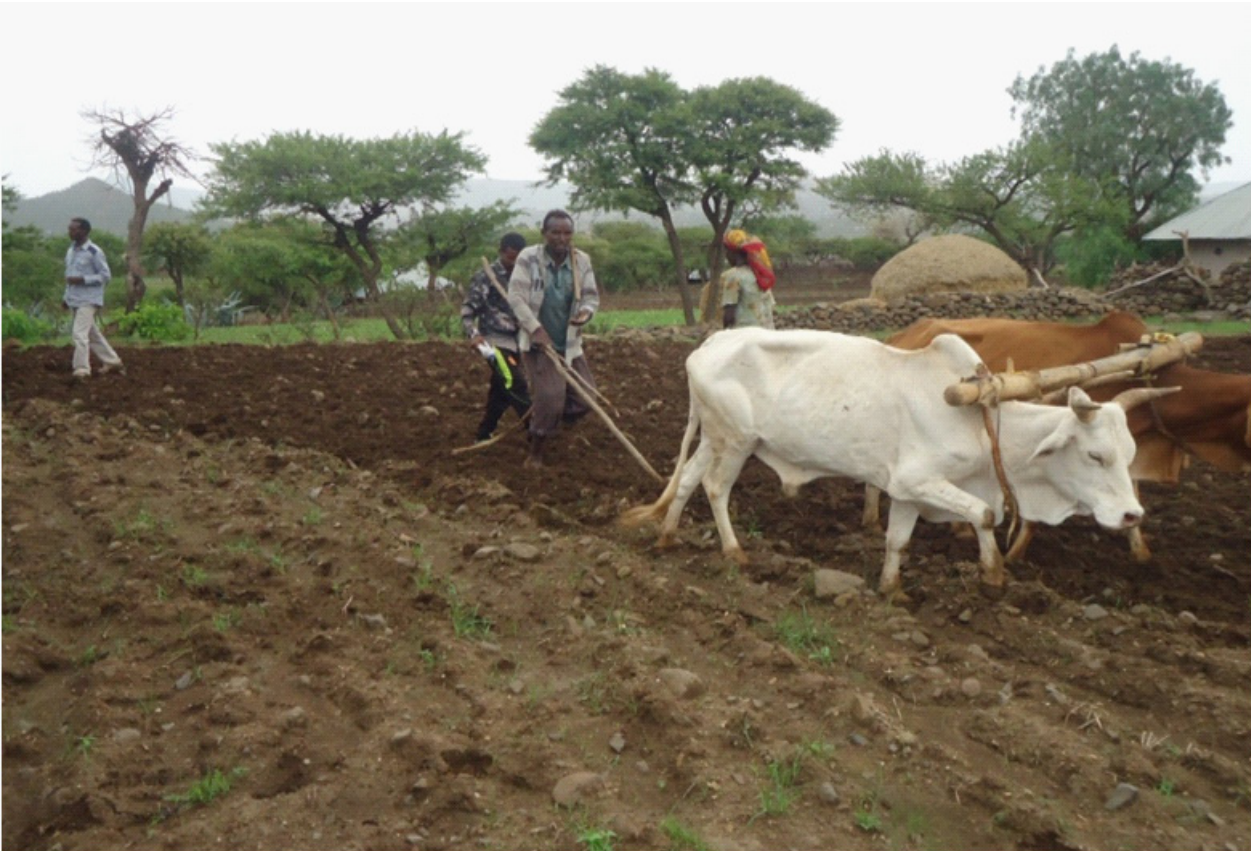
ፍርያት ንምዕባፍ ዝተሰላሰለ ምልሳሳ መሬት

ካብዚ እም ኣዕታር ከይሓወሰ 13,720 ሄክታር ብዘራእቲ ተሸፊኑ እዩ። ኣብዚ ንጥፈታት እዚ ዝሳ ተፋ ሓረስታይ 14,341፣ መንእሰይ 7,344 ደቂ ኣንስትዮ 6,810 እንትኹን ብድምር 28,495 ተጠ ቀምቲ እዮም።