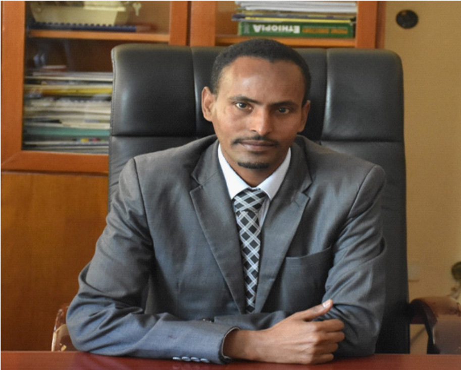
መካየዲ ስራሕ ፋብሪካ መድሓኒት ኣዲስ ኣይተ ሃይለ ገ/ማካኤል

ፋብሪካ መድሓኒት ኣዲስ ናብ መኸሰብ ዝተሰጋገረ ካብ 2002 ዓ/ም ጀሚሩ እዩ። ዝነበረ 500 ሚልዮን ውህሉል ዕዳ ኣብ 2002 ዓ/ም እዩ ምክፋል ጀሚሩ። ዕድሑ ወዲኡ ናብ ከሰቢ ኣትዮ ዘሎ ኣብዘም ዝሓለፉ 3 ዓመታት ጥራሕ እዩ። ሕዚ ኣብ ዘተኣማምን ሃዋህውን መንገድን ድማ ይርከብ። ንኣብነት ዘፍርዮም መድሓኒታት