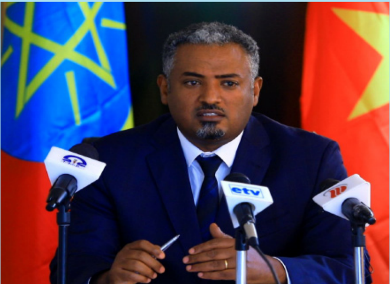
ሓላፊ ቢሮ ልምዓት ሕርሻን ገፀርን ክልል ትግራይ ዶክተር ኣትኩት መዝገብ