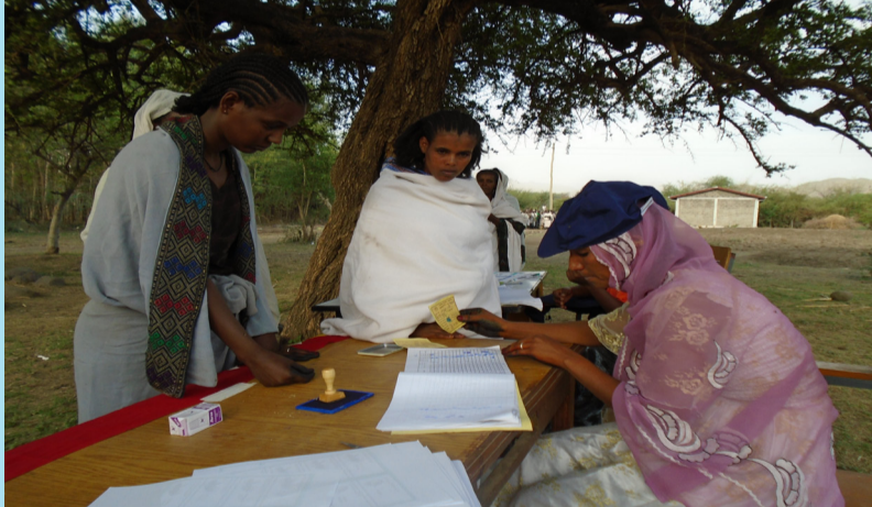
መረፃ 2007 ዓ/ም ብክፋል (ፋይል)